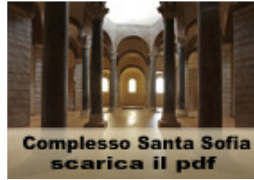
Complesso Santa Sofia scarica il pdf