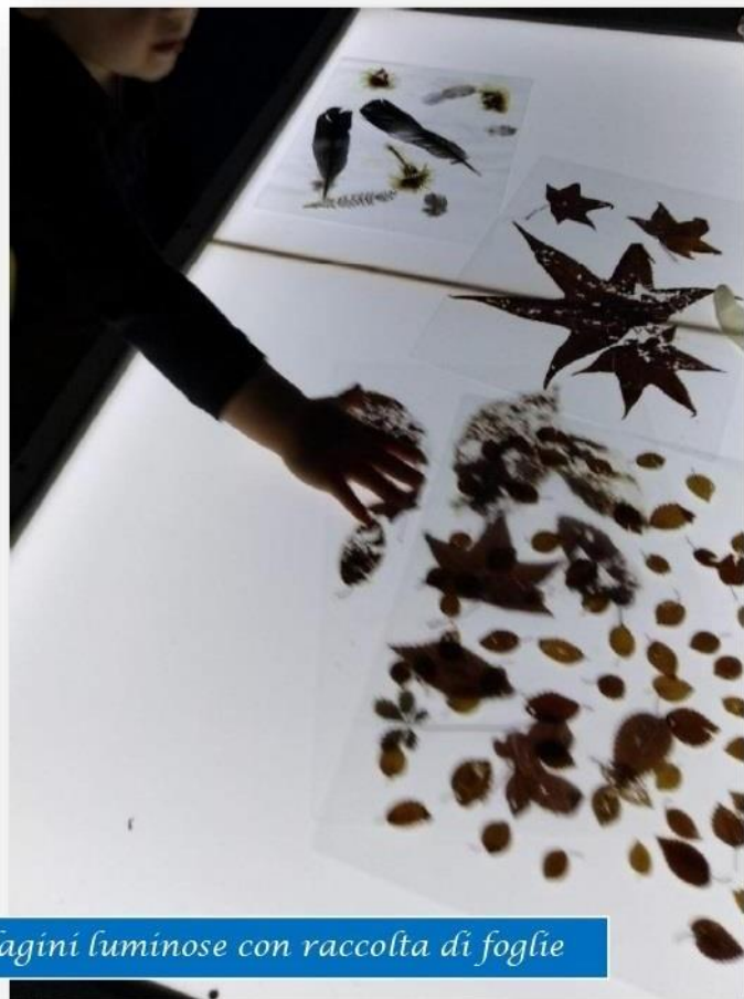
Indagini luminose con raccolta di foglie

L'offerta ludica è ricca di materiale "povero", non strutturato, materiale naturale e di recupero, per le sue capacità di promuovere curiosità e