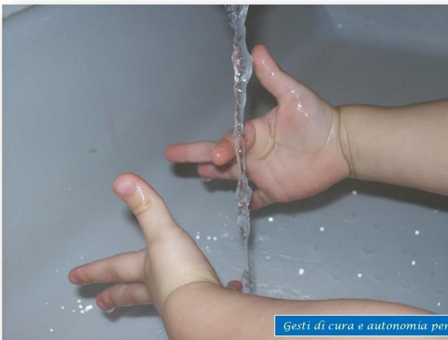
Gestì di cura e autonomia personali

il momento per ritrovarsi dopo la giornata vissuta al nido, un'occasione per lo scambio con le figure familiari