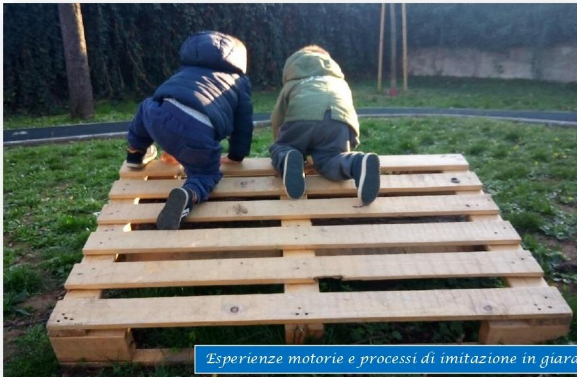
Esperienze motorie e processi di imitazione in giardino

L'offerta ludica è ricca di materiale "povero", non strutturato, materiale naturale e di recupero, per le sue capacità di promuovere curiosità e voglia di sperimentare fornendo importanti opportunità di percezioni olfattive e tattili, di esplorazione e combinazione. Attraverso l'utilizzo di materiale povero, di recupero e non strutturato è possibile perseguire, sostenendo l'interesse spontaneo dei bambini, il potenziamento di molte abilità che naturalmente anche i più piccoli mettono in campo all'interno del contesto laboratoriale.